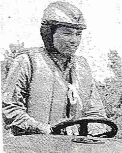
ハンドルを握ってちょっと緊張

ホーバークラフトの運転は、全身を使った運転がポイントです。ハンドルをバイクの要領で握り、アクセルを踏み込むことで、速く進むことができます。また、舵を切る際には、上半身を傾け、体重をかけることで、より正確な操縦が可能です。大会では、選手たちはこれらのテクニックを駆使し、激しい競争を繰り広げました。