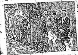
赤松知事(右)と東京府議会議員(左)らと、東京府議会の会合で。

白ロシン首相が 知事を表敬訪問 東京府知事赤松義典(右)と東京府議会議員(左)らと、東京府議会の会合で。